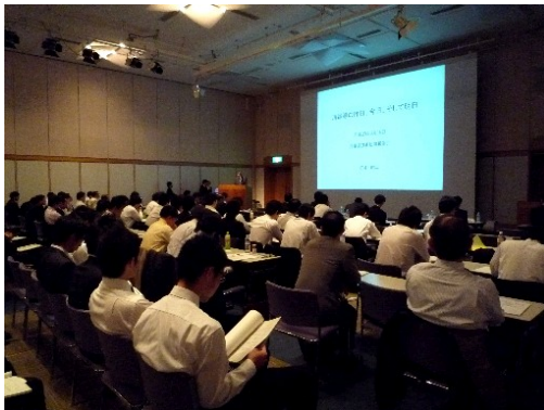
超電導技術動向報告会

これらの開催状況については、電子情報誌「超電導 Web21」の特集号として掲載し、広く情報提供を行った。